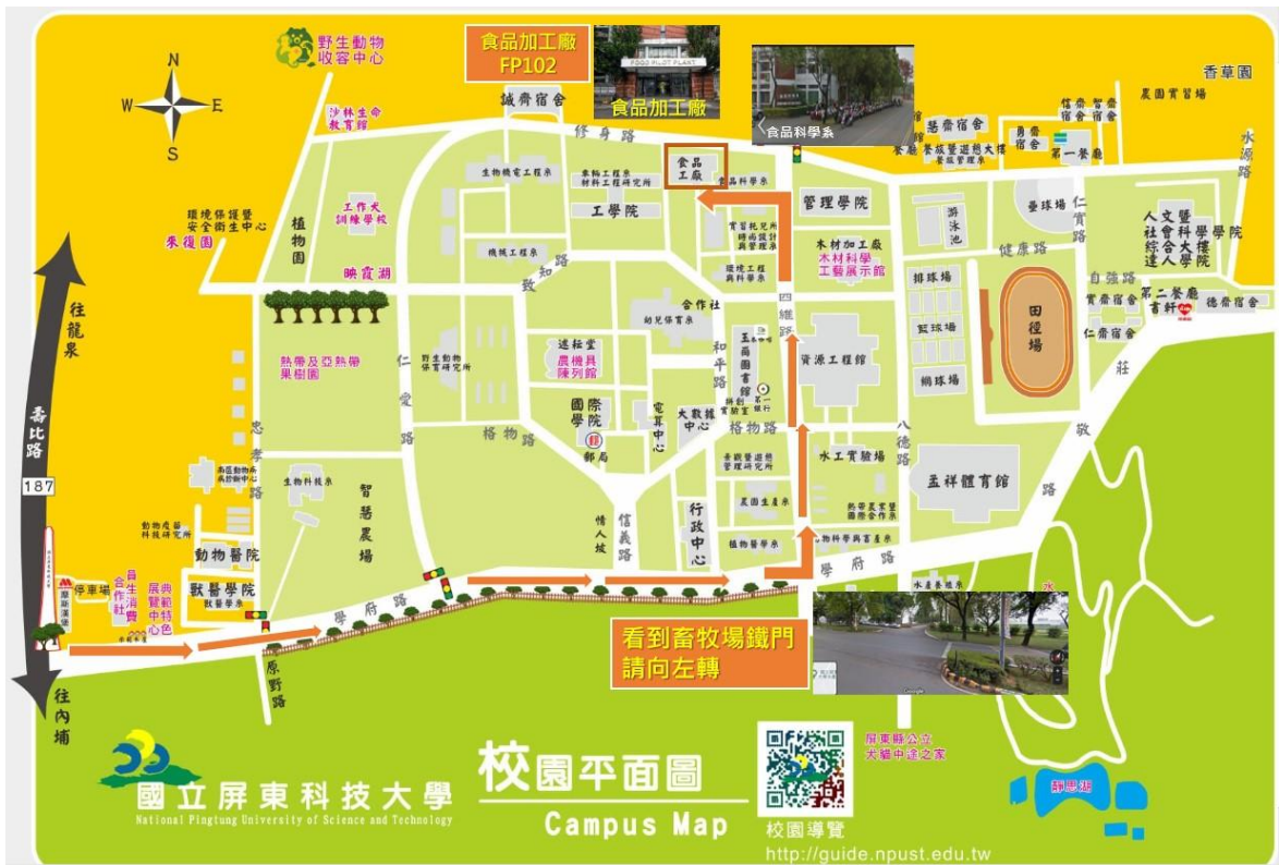
食品科學系及食品加工廠位置示意圖