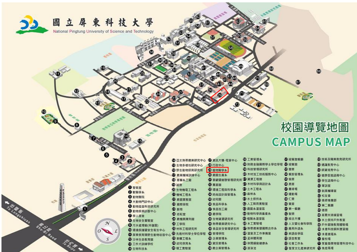
圖 2 校園導覽圖 (本系編號 29-植物醫學系)