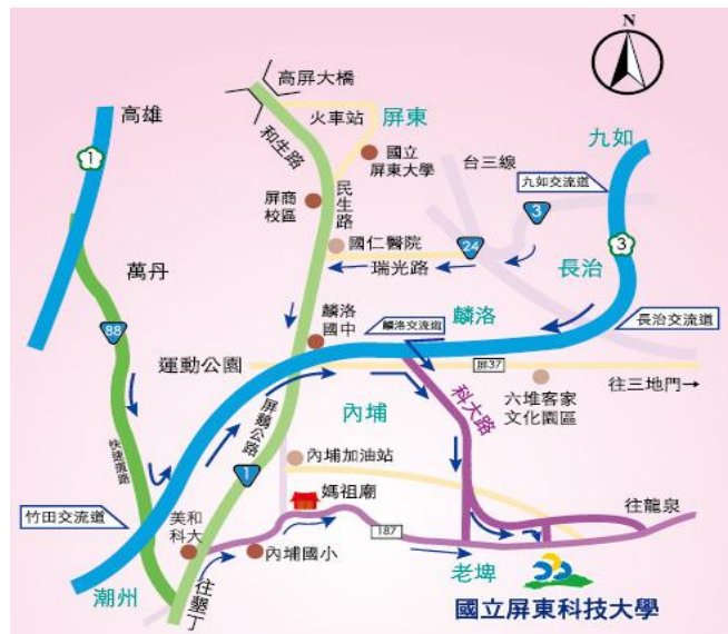
圖 2 開車來校路線圖

開車來校路線圖詳如圖 2；校園導覽圖詳如圖 3 (本系編號 41-資源工程館)：進本校校門口後，直走學府路(5 個路口)至四維路左轉，直走土木工程系將在右側(圖書館斜對面)。