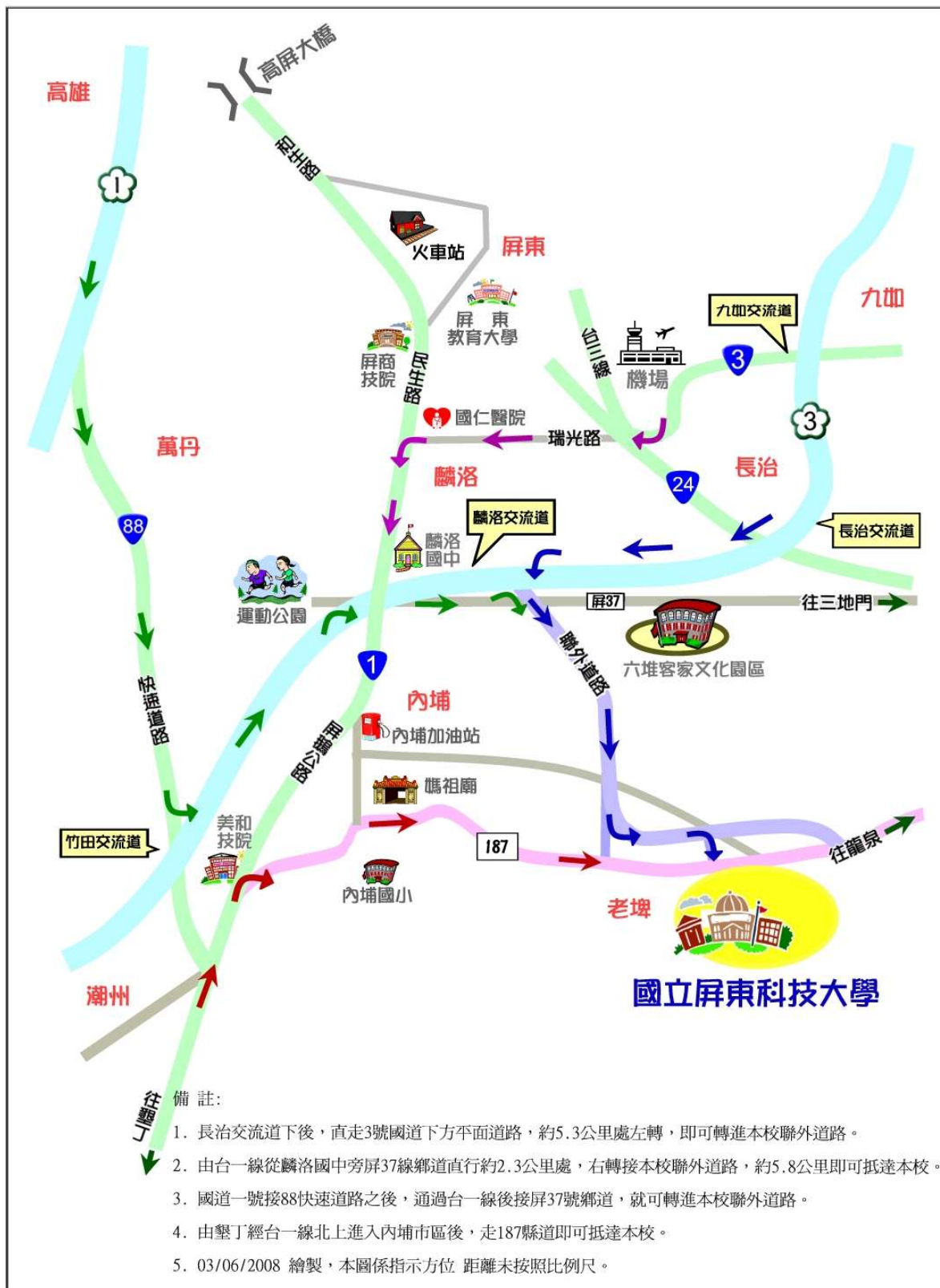
國立屏東科技大學位置示意圖