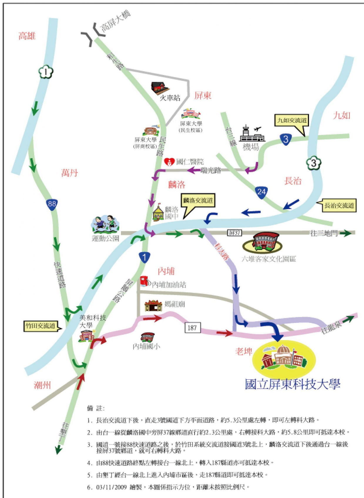
國立屏東科技大學位置示意圖