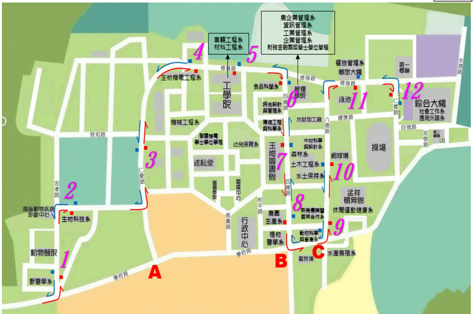
接駁專車校內停靠站(12 站)及重要路口(A~C)交通諮詢人員位置 圖二