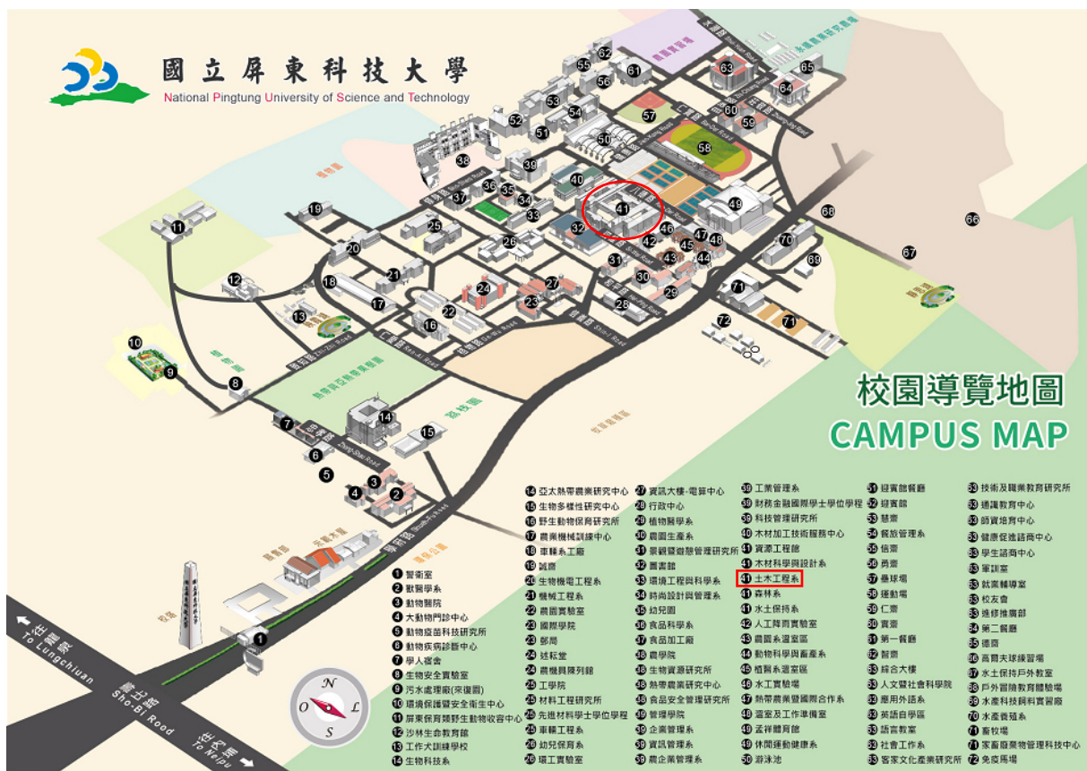
圖 3 校園導覽圖 (本系編號 41-資源工程館)