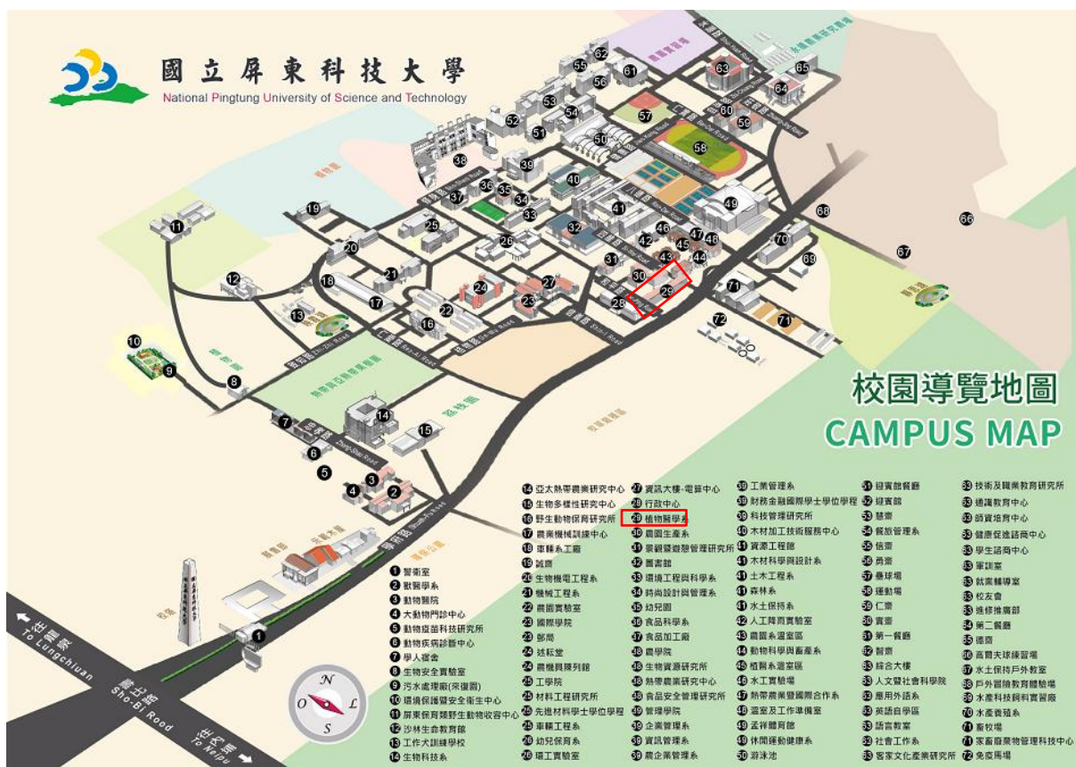
圖 2 校園導覽圖 (本系編號 29-植物醫學系)