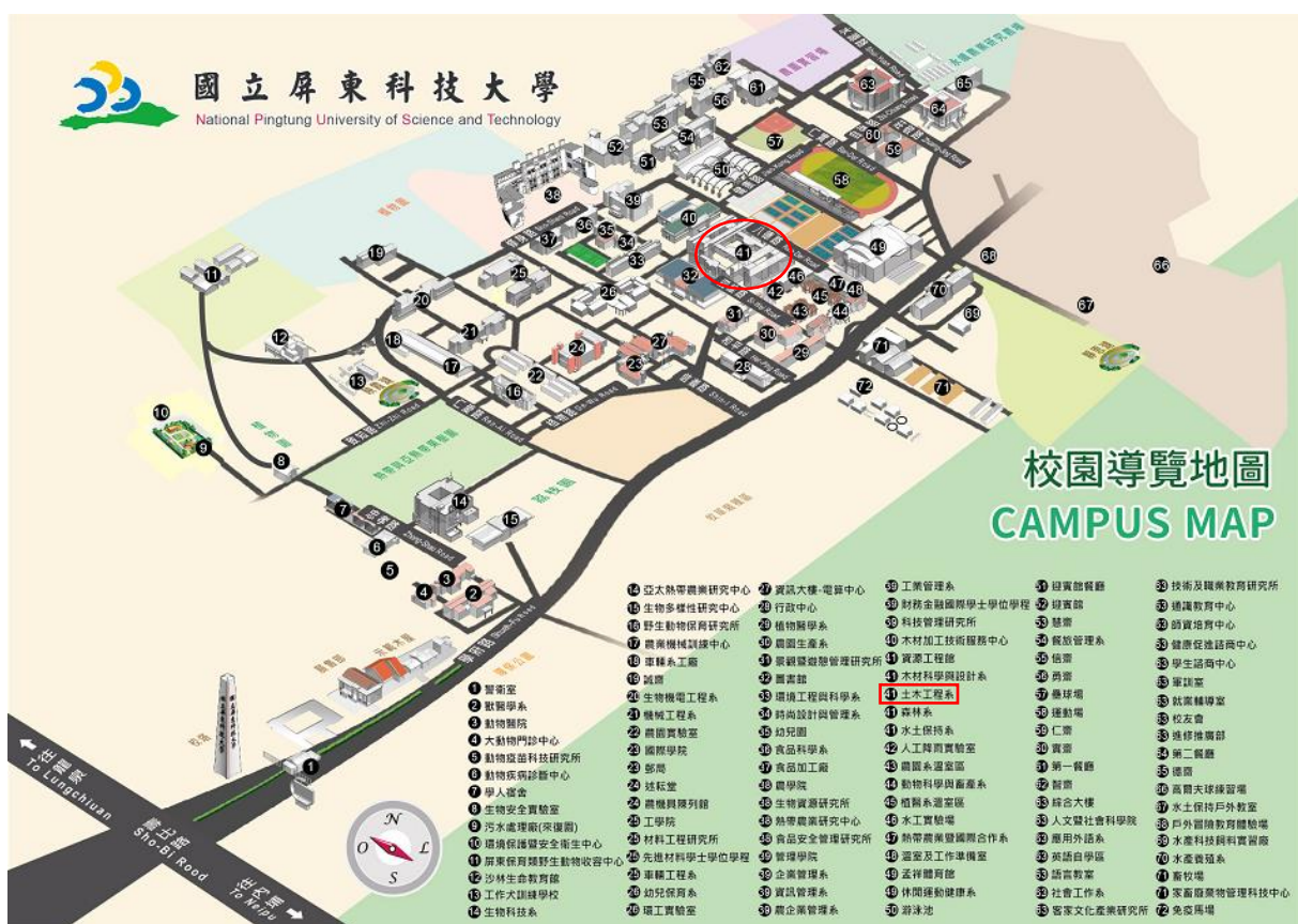
圖 3 校園導覽圖 (本系編號 41-資源工程館)