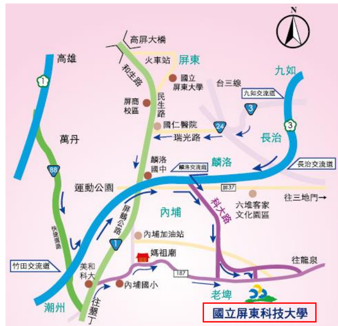
圖 2 開車來校路線圖

開車來校路線圖詳如圖 2；校園導覽圖詳如圖 3 (本系編號 41-資源工程館)：進本校校門口後，直走學府路(5 個路口)至四維路左轉，直走土木工程系將在右側(圖書館斜對面)。