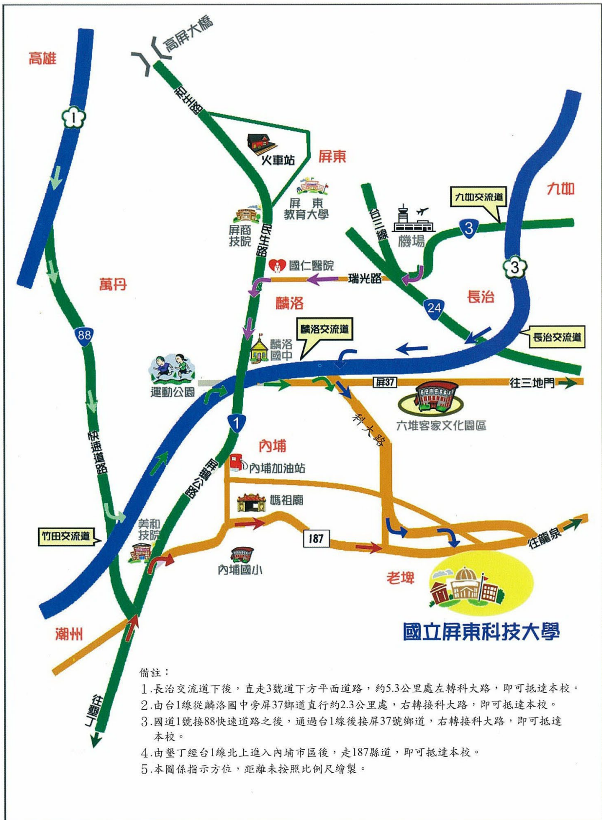
國立屏東科技大學位置示意圖