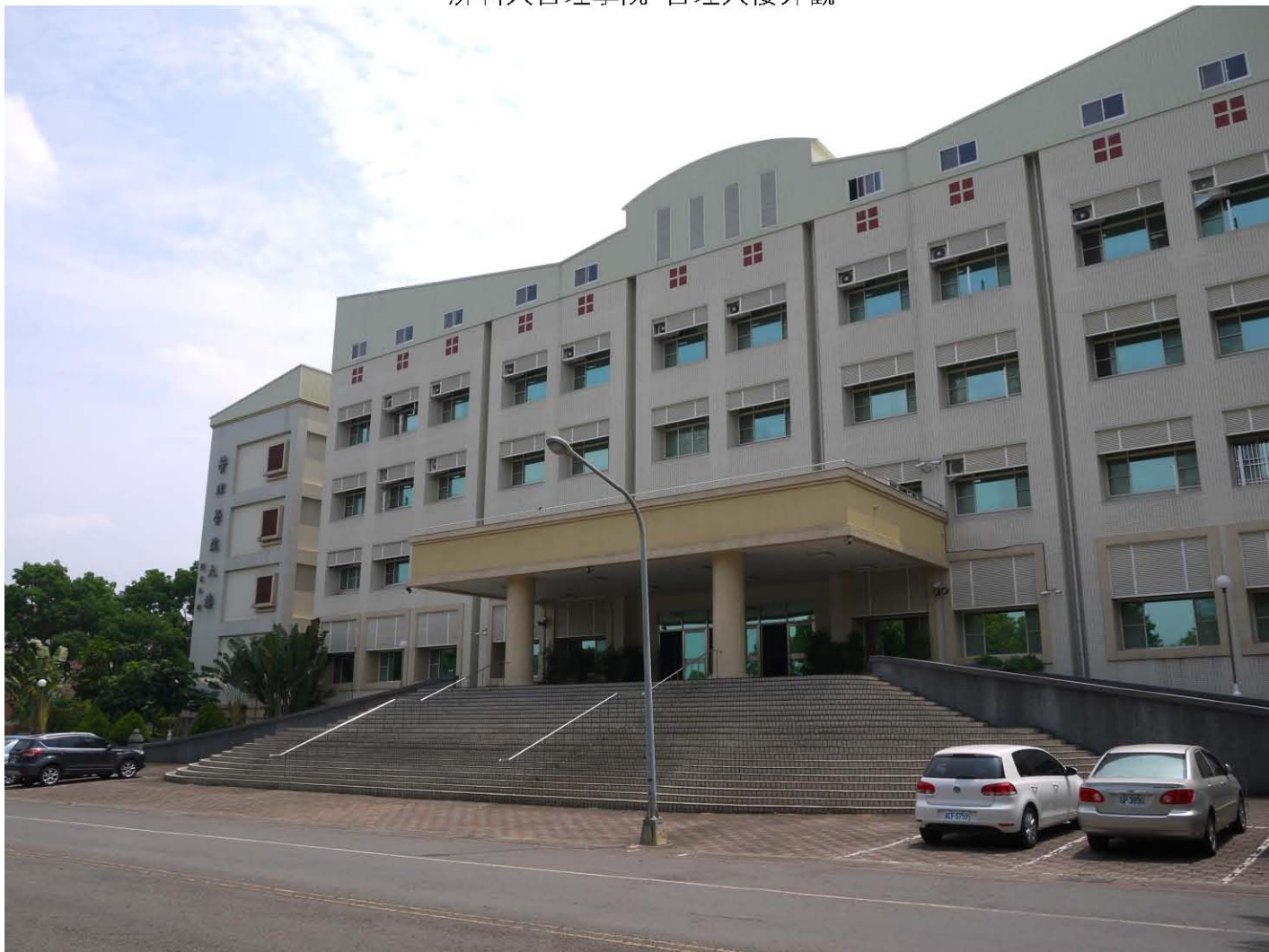
屏科大管理學院 管理大樓外觀