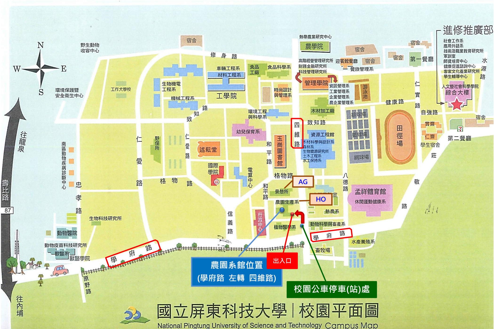
國立屏東科技大學 | 校園平面圖 National Pingtung University of Science and Technology Campus Map