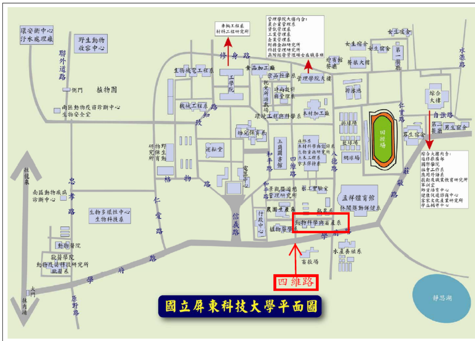
動物科學與畜產系位置圖